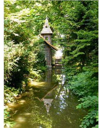
A zenélő malom

A természetet utánzó tájképi kertet dendrológiai parkká, gyönyörű kertté varázsolták, beleszervezték a szentimentális stíluskorszak motívumait. A kertben átfolyó Szécsény-Rákospatak vizét felhasználva és a régi nagy tavat is bevonva tórendszert alakítottak ki; a kitermelt földdel a lankás domboldalakat tették változatosabbá. Az építéséhez szükséges homok-, mészkő- és dolomittömböket a Vác fölötti Naszály hegyről szállították ide. A sokszor 10-15 mázsás kövekből sziklacsoportokat, sziklás hegyoldalakat formáltak. A patak partját sziklával rakták ki, hogy természetesebbnek tűnjön.