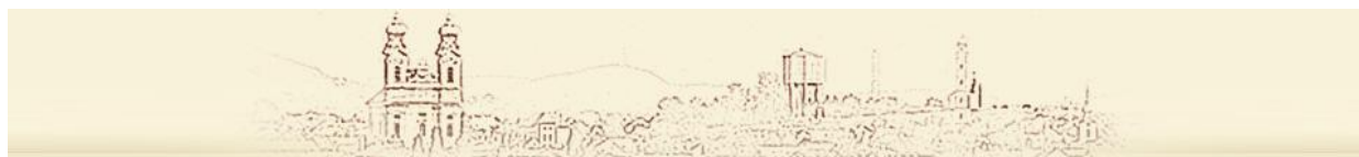
Tata régi f tér